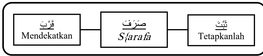
Diagram 2.3: Medan Semantik Paradigmatik (Antonim) Kata Sarafa (صَرَفَ)

(antonim) kata Sarafa (صَرَفَ) dalam al-Qur'an, berikut diagramnya: